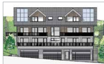
«Säntisstrasse 15»: An der Säntisstrasse 15 ist ein Bauprojekt der H. Lanker Bau GmbH vorgesehen: ein Grundstück mit bewilligtem Projekt für ein Dreifamilienhaus; derzeit werden Interessenten für das Bauland oder zukünftiges Stockwerkeigentum gesucht.