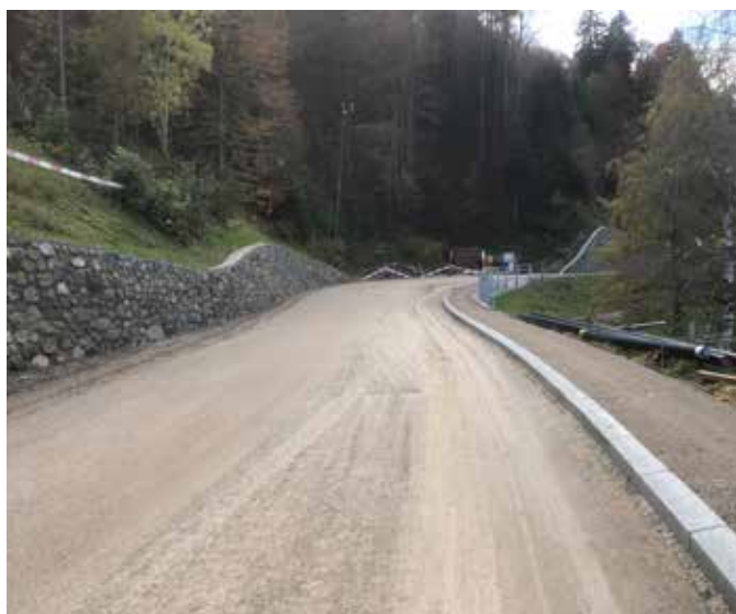
Der Ausbau der Kantonsstrasse Schwellbrunn-Schönengrund mit einem Gehweg wird im Rahmen des 4. Strassenbauprogramms 2023–2026 realisiert.