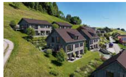
«Alpsteinsicht»: Das Projekt «Alpsteinsicht» wird von der Wako Montagen GmbH umgesetzt und durch die Raumpioniere AG verkauft; realisiert werden Einfamilienhäuser sowie Wohnungen.

In der Ausgabe April 2026 kam es in der Berichterstattung über die Bauprojekte an der Säntisstrasse zu einer ungenauen Zuordnung. Dafür möchten wir uns bei unseren Leserinnen und Lesern sowie den beteiligten Unternehmen entschuldigen.