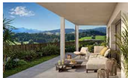
«Säntisblick»: Beim Projekt «Säntisblick» der Ammann & Ehrbar Immobilien AG werden vier Reihenhäuser realisiert und verkauft.