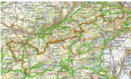
Kartenausschnitt von Schweizmobil. Die Route 22, «Kulturspur Appenzellerland», führt von Urnäsch nach Walzenhausen durch ganz Ausserrhodener.