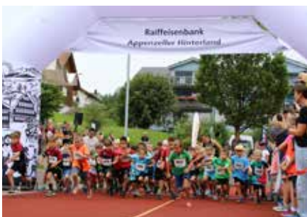
Start Kinderläufe 2024

Start und Ziel befinden sich inzwischen beim Mehrzweckgebäude – dort ist alles zentral