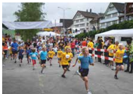
Start des Familiensprints 2010