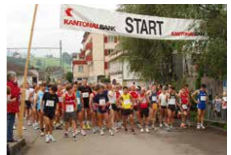
Start Hauptlauf 2005