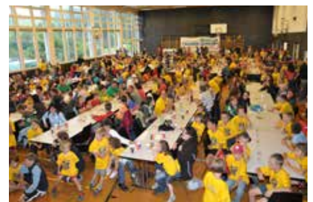
Rangverlesen im MZG 2010

organisiert: Zeitmessung, Umkleiden, Verpflegung, Rangverkündigung. Ein grosser Schritt, der 2021 vollzogen wurde – und den Charakter des Laufs nochmals deutlich aufgewertet hat. Ein weiterer bedeutender Meilenstein in der Entwicklung des Laufs war die Einführung der elektronischen Zeitmessung mittels Chip in der Startnummer.