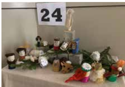
Einfache Krippe aus WC-Papierrollen in der Kirche Bühler.