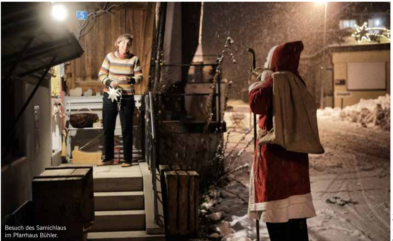
Besuch des Samichlaus im Pfarrhaus Bühler.