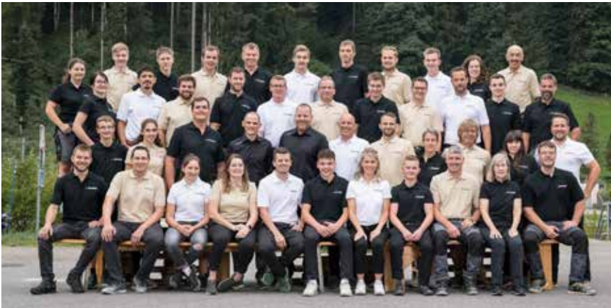
Das Blumer-Team mit seinen neuen Arbeitskleidern.