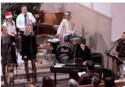
Familiengottesdienst in Bühler mit der «New Earth Army Band».

In Japan hingegen ist Weihnachten kein religiöses Fest. Es wird eher als romantischer Anlass gefeiert. Paare gehen gemeinsam essen und es ist Tradition, an Heiligabend einen speziellen Weihnachtskuchen zu essen.