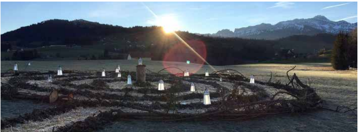
Mitten in der geschäftigen Zeit einen Moment innehalten und sich auf das Wesentliche besinnen, das bietet der «Weg zum Licht» vom 1. Dezember 2024 bis 10. Januar 2025 beim Seniorenheim Bad Säntisblick.