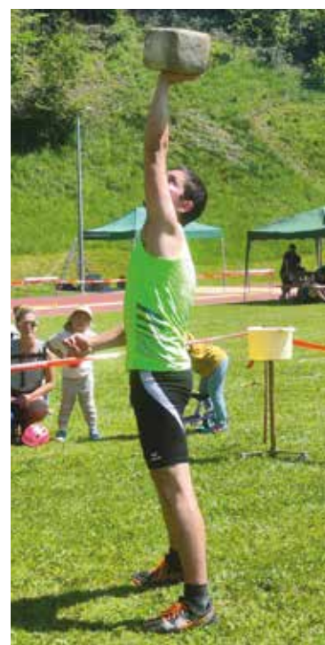
Der Turnverein Waldstatt geht gut vorbereitet an Turnfeste.