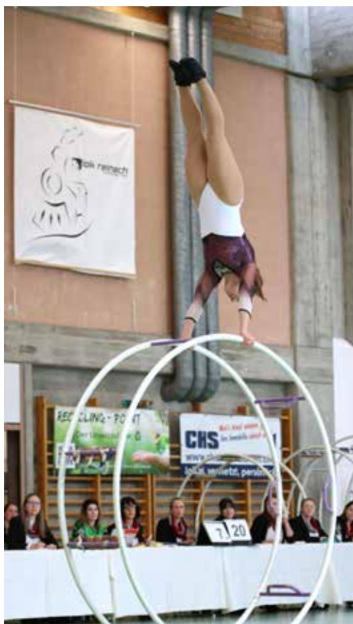
Handstand am rollenden Rad von Chiara Lenzo. Sie vertritt die Schweiz an der WM in der Kategorie Aktive.

Nach der Wahl des Turnfests sowie der Entgegennahme der Disziplinenanmeldungen aller Mitglieder, starten jeweils im Februar die Turnfesttrainings. Die schweisstreibenden Trainings sind gut besucht und nur dank dem grossen Aufwand und Engagement der Disziplinenleiterinnen und -leiter möglich. Besonders wichtige Bestandteile der Turnfestvorbereitung sind das Trainingsweekend sowie die Teilnahme an Vorbereitungswettkämpfen. Den Abschluss der Turnfestvorbereitung macht das Showturnen. Beim Showturnen am Mittwoch, 12. Juni 2024, werden nach dem UBS Kids Cup im MZG ab 19:00 Uhr die Disziplinen der Aktiven gezeigt. Für die Aktiven ist dies eine Art Hauptprobe, bevor es Mitte Juni ernst gilt.