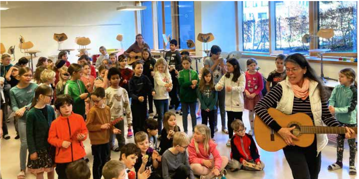
Die Kinder lernten Lieder aus fernen Ländern.