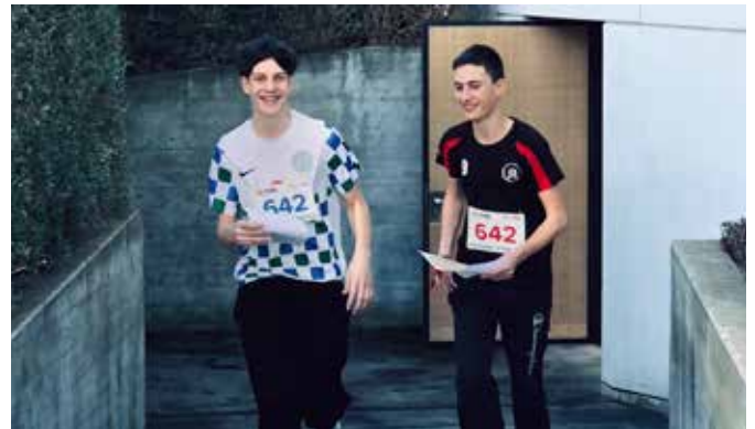
Der Orientierungslauf in Appenzell machte Spass.

Der Donnerstagmorgen startete mit einem NT-Unterricht, wie wir ihn wahrscheinlich so noch nie erlebt hatten. Wir gingen in die Kochschu-